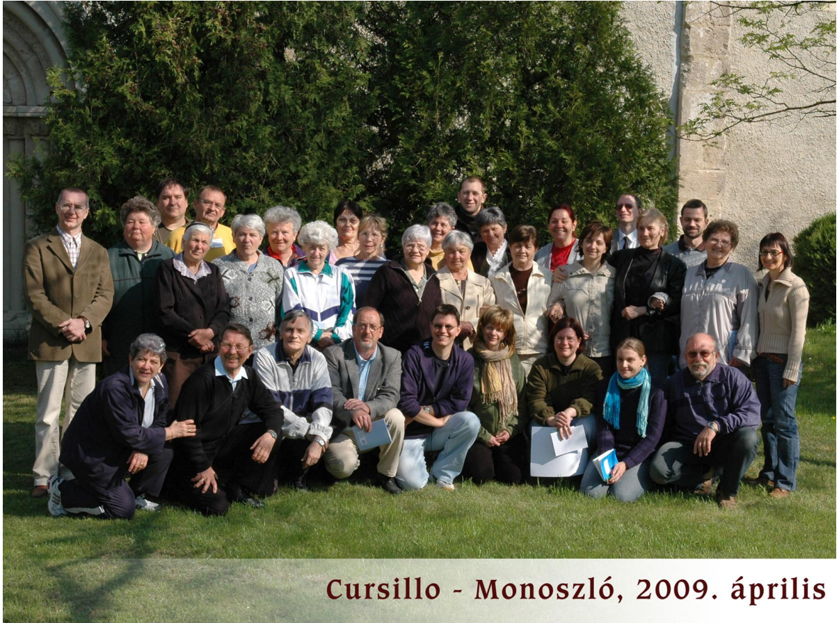
Cursillo - Monoszló, 2009. április